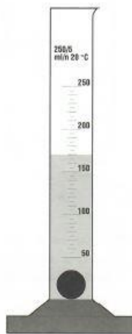
objem vody v odmernom valci po vložení kameňa

Doplň: Objem vody v odmernom valci je ..... ml.