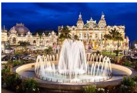
Kasíno v Monte Carle