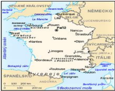
Poloha Francúzska v Európe

Francúzsko susedí so 6 štátmi (Belgicko, Luxembursko, Nemecko, Švajčiarsko, Taliansko a Španielsko).