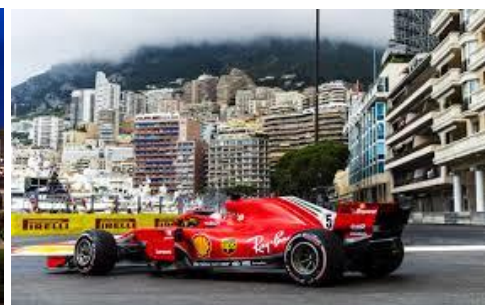
Preteky F1 v Monaku