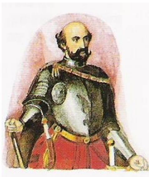
Matúš Čák Trenčiansky