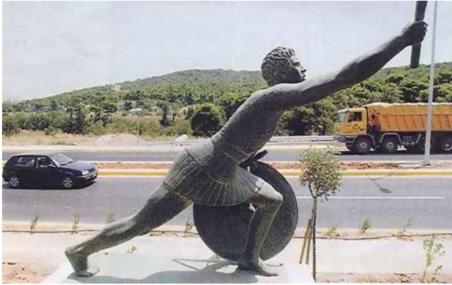
Bežec, ktorý oznámil víťazstvo Grékov.