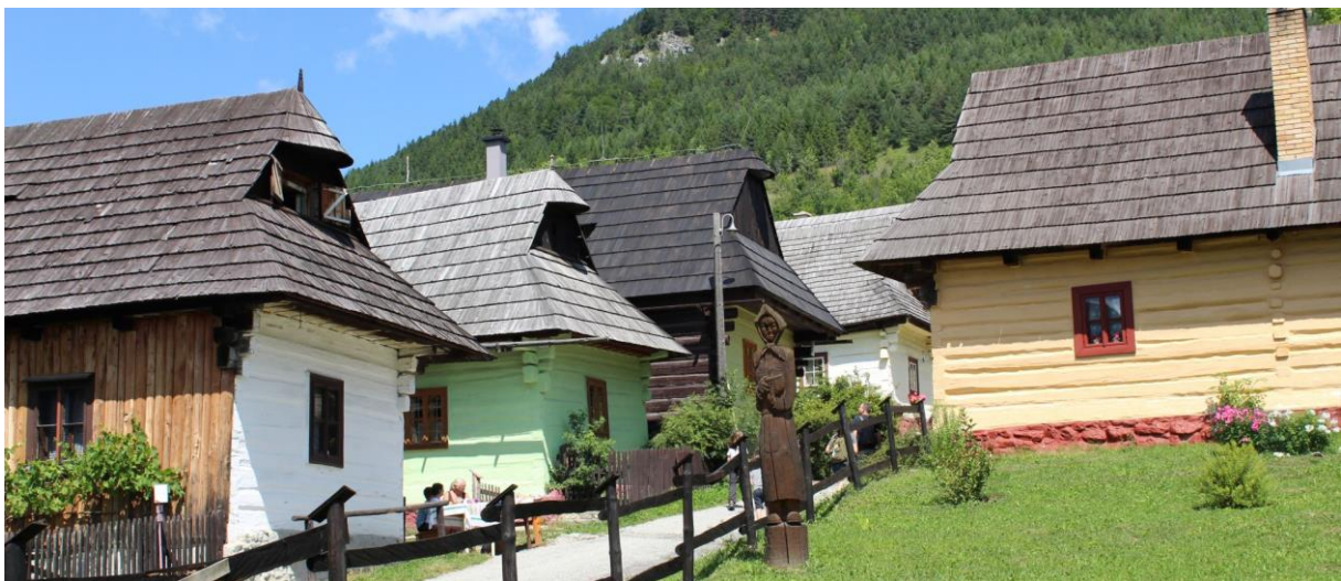
Vlkolínec pri Ružomberku- UNESCO- historická „dedinka“